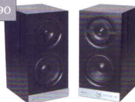
Raumfeld Stereo M