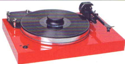
Pro-Ject Xtension 9 Superpack