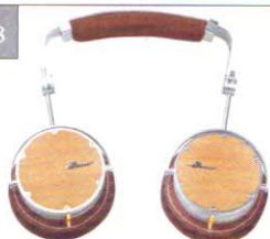
Stymax obravo HAMT-1