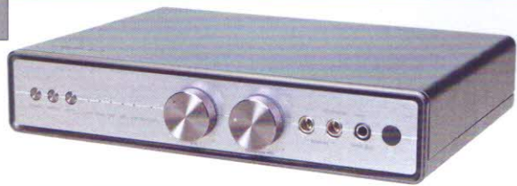
Asus Essence 3