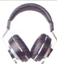
Final Audio Design Pandora Hope VI