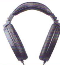
Koss ESP 950