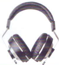
Final Audio Design Pandora Hope VI