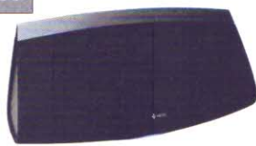
Denon Heos 7