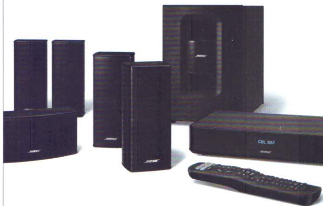
Bose Cinemate 520