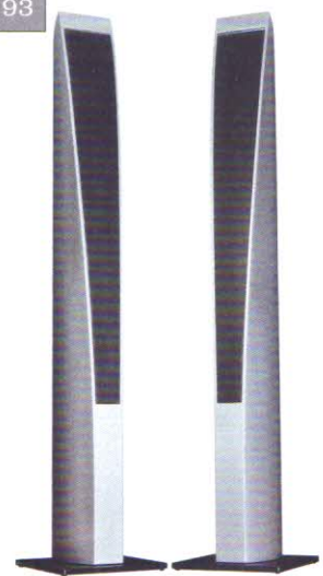
Revox Scala 120