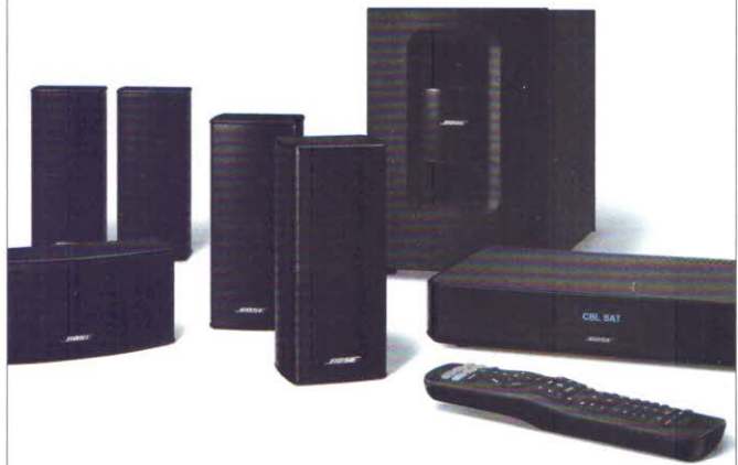
Bose Cinemate 520