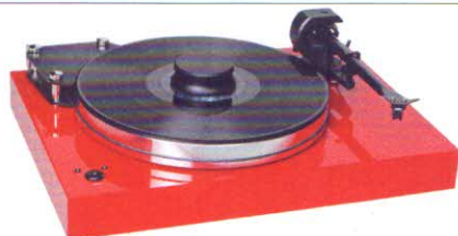
Pro-Ject Xtension 9 Superpack