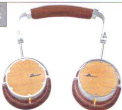
Stymax obravo HAMT-1