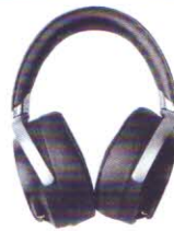
Sony MDR Z7