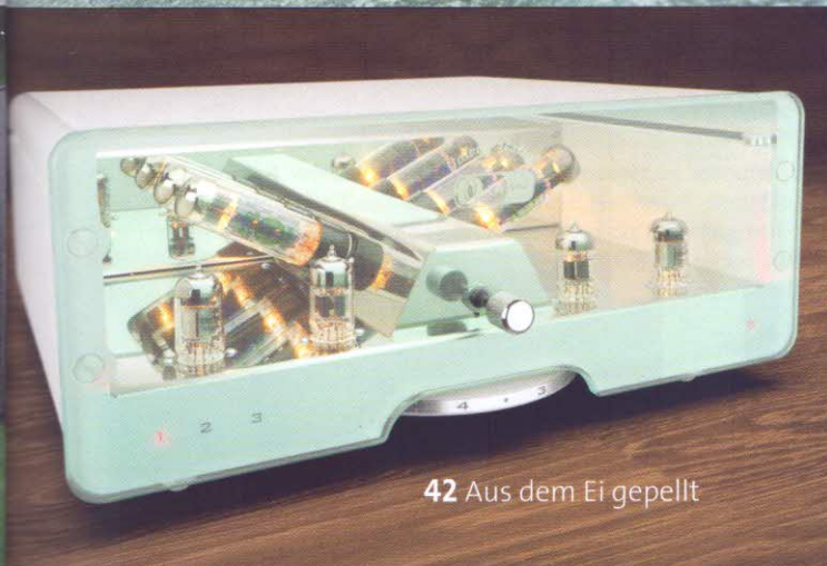
42 Aus dem Ei gepellt