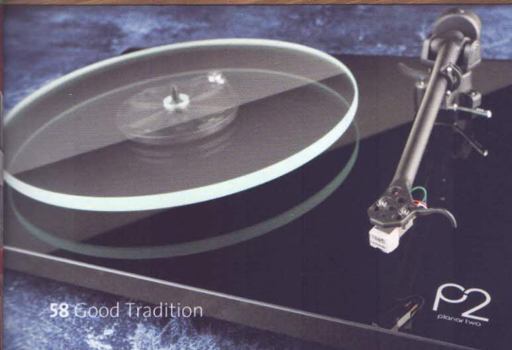
58 Good Tradition