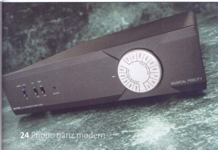
24 Phono ganz modern